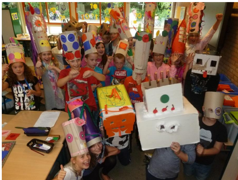
De hoedjesparade 2015

In zeer uitzonderlijke gevallen is het beter voor het kind dat het een jaar langer in dezelfde groep blijft. Een dergelijke beslissing komt tot stand in overleg met de betrokken leerkrachten, de intern begeleider, de ouders en de directie. De eindverantwoordelijkheid ligt bij de directeur.